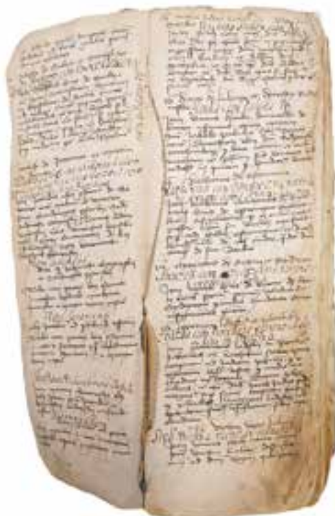
Fot. 2. Zapisy w księdze na k. 4v-5

m.in. datę podjęcia napraw), a na końcu trzy (obecnie bardzo już uszkodzone, k. 351-353). Sama późnośredniowieczna część książki liczy 342 papierowe karty (k. 1-350; foliacja ta, powstała na przełomie XVII i XVIII wieku, nie jest już jednak w pełni adekwatna do stanu książki, czasem też zawiera zwykłe błędy 19 ). Karty