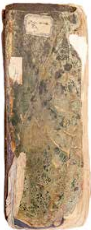
Fot. 1. Przednia okładzina książki